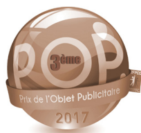
Prix de l'Objet Publicitaire Lauréat de Bronze 2017