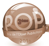
Prix de l'Objet Publicitaire Lauréat de Bronze 2016