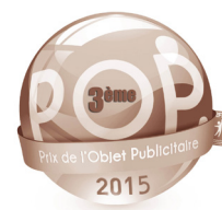
Prix de l'Objet Publicitaire Lauréat de Bronze 2015