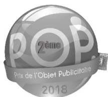
Prix de l'Objet Publicitaire Lauréat de Bronze 2018